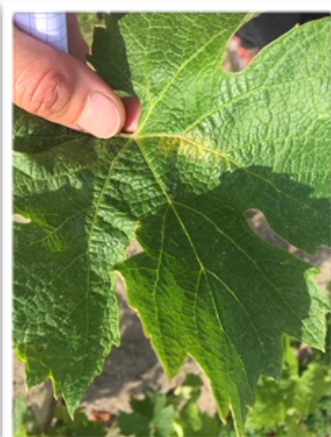
1 tache mildiou sur feuille

Observation de mildiou sur 1 rameau secteur St Macaire, et 1 rameau sur Montagne