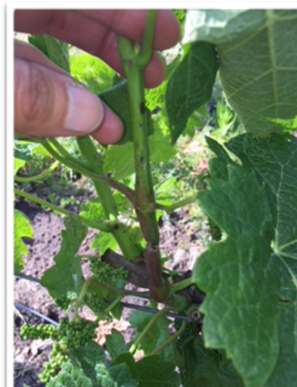
Symptôme mildiou sur rameau