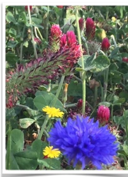
Une petite Centaurée attire le regard ...

Dans ce LA BULLE N°6, vous sont proposées des actions concrètes. Restez zen !