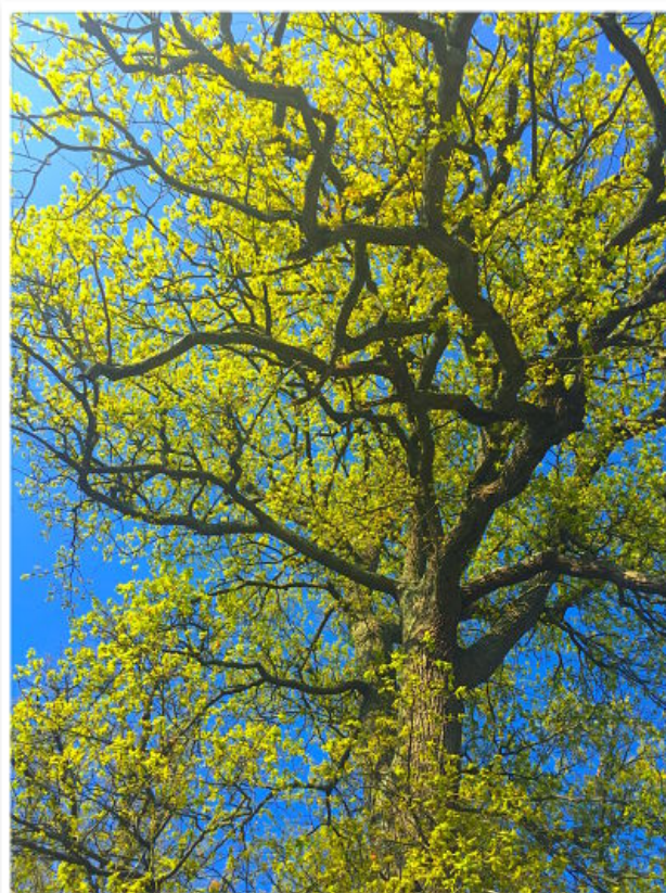
Chêne fin mars 2016

Profitez de cette semaine aérée pour finaliser vos travaux des sols, tenir les cavallons, réaliser vos complantations en Lune descendante (d'aujourd'hui à mardi 26 avril). Le contexte cryptogamique cette semaine étant d'un niveau peu préoccupant. Consacrez ce temps à la réalisation de vos soins biodynamiques, il y a de belles configurations planétaires en vue. Mettez-les à profit pour donner le ton sur vos parcelles. Cf chapitre Soins biodynamiques - Interagir avec les sphères d'énergie planétaires.